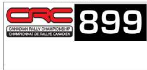
(Co-Drivers RH Side)